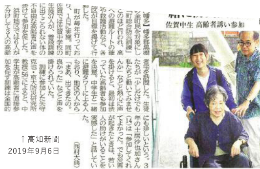
↑ 高知新聞 2019年9月6日